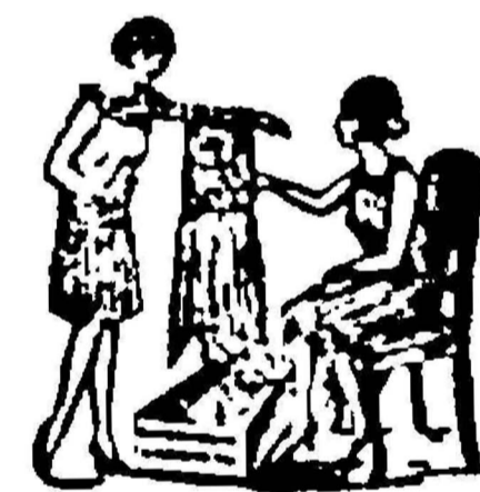
„Timana andjeun ngengkonkeun njeu- seuh (njelep) sakieu saena?“

Stationsweg No. 30 TASIKMALAJA Naast GEBEO.